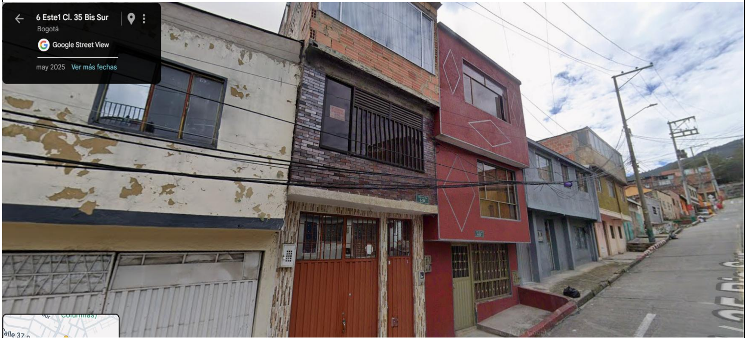
IMAGEN 1: NOMENCLATURA