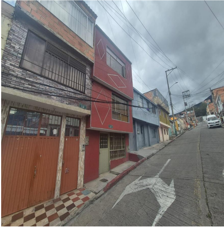
IMAGEN 3: FACHADA LATERAL